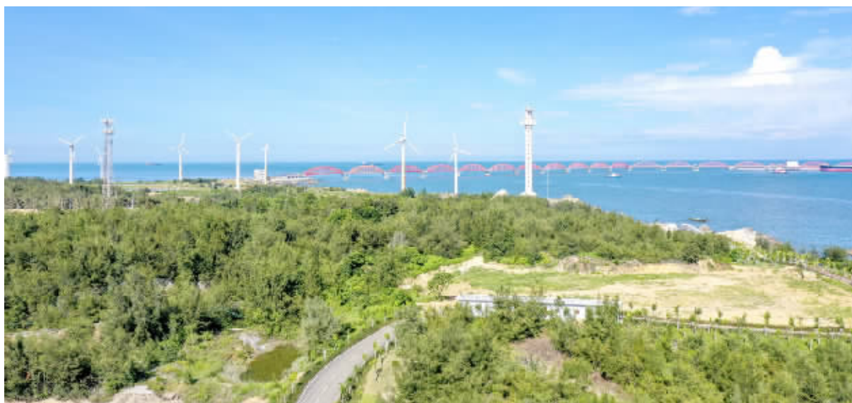
惠来县以点带面促进绿美生态建设提质升级。图为该县网红景点靖海镇石碑山片区。

如今,在社交媒体上,靖海镇石碑山片区已成为惠来的一处网红打卡地,市民游客纷纷在社交平台上分享游玩攻略及山海美景。那么该片区是如何变身成为惠来的网红打卡地?记者从惠来县有关部门了解到,该县通过原生植草海桐、厚藤对靖海镇海岸线进行边坡复绿与加固,对一些裸露地面通过自然更新或人工辅助方式进行绿化修复,包括海岸整治绿化、步道沿线绿化在内,总绿化面积10756平方米;建设绿化防护林6992平方米,对海岸线周边约6.3公顷范围内的区域进行全面清理整治,共修复约750米的海滩海岸线,形成海滩面积32411平方米;打造了粤东地区唯一一个集爱国主义教育、科普宣传、旅游观光、亲子活动、海景拍摄、休闲康养于一体的领海主权爱国主题公园——石碑山领海主权爱国主题公园。通过以上卓有成效的举措,靖海镇石碑山片区成功晋升为绿美广东生态建设示范点,成为构建“林和城相依、林和人相融”的高品质城乡绿美生态环境的典型代表。