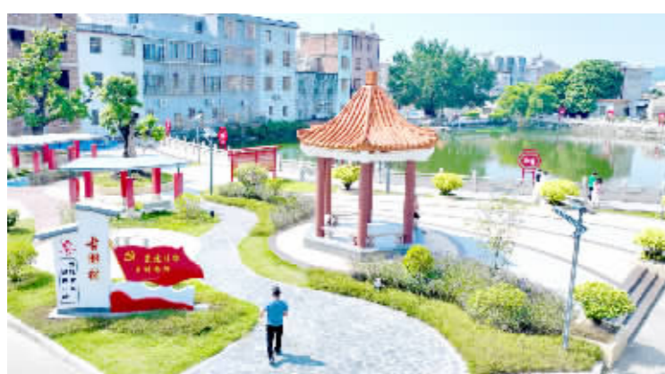
云路镇因地制宜建设“四小园”。

本报讯 (记者 李健伟 许佳曼 通讯员 沈晓珊) 阶段来,云路镇积极推进农村人居环境整治,充分盘活各村闲置零散土地,鼓励村民对房前屋后边角地进行合理规划,因地制宜建设“四小园”,以“小切口”促进农村人居环境“大提升”,用“绣花”功夫点缀和美乡村画卷,不断提升群众的获得感、幸福感。